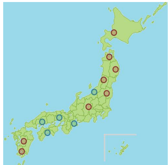
マップ上で数字の低い店舗、高い店舗を可視化！