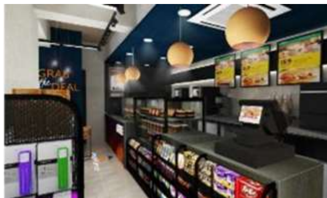
<レジカウンター デザインイメージ>