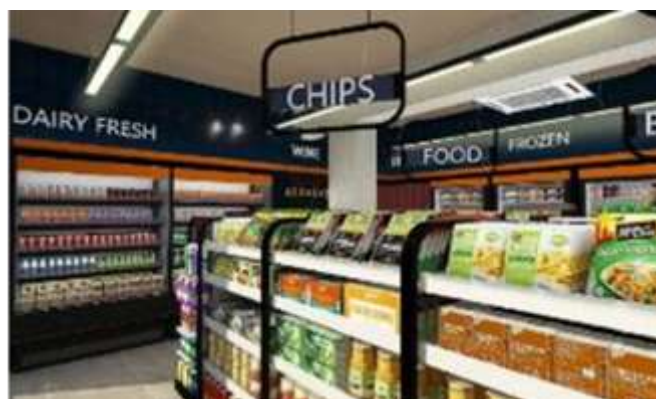
<店舗内観 デザインイメージ>