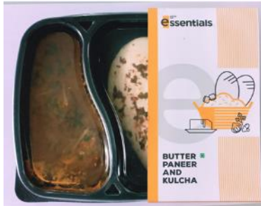
バターパニールクルチャ