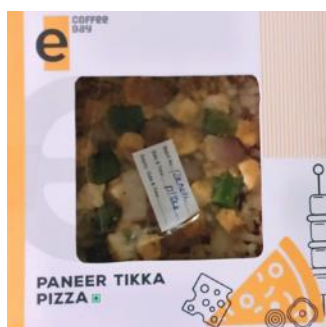
パニールティッカピザ

コンビニエンスストア成功のカギは、オリジナルフードの充実。インドには、伝統的な「キラナ」という小売店舗が1400万店舗・98%を占め、アッパーミドル層のニーズに合った小売店舗が存在していないのが現状です。インディアンフード、ウェスタンフード、ベジタリアン・ノンベジフードなど、オリジナルフードの品揃えの幅を広げることで、アッパーミドル層のニーズに合ったデリーフードを展開していく予定です。