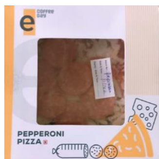
パニールオニピザ