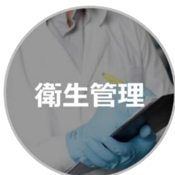
衛生管理が徹底された食品製造に適した環境

オリジナルフードの生産は、すでに Coffee Day Group が提携しているインド全土に 17 カ所ある食品工場で生産を予定しております。同食品工場は ISO を取得しているとともに、HACCP 基準を満たしております。品質管理は万全で、原材料も高品質なものを使用するため、1 号店オープン時から「安心・安全な商品を製造」することが可能です。