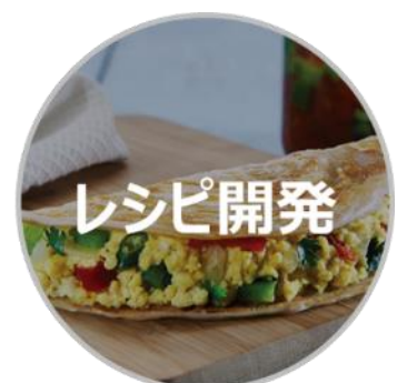
アッパーミドル層が満足するレシピ開発

※ ISO とは、「International Organization for Standardization(国際標準化機構)」のことを指します。