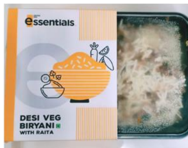
デジベッグピリヤーニ