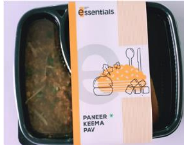
パニールキーマパブ