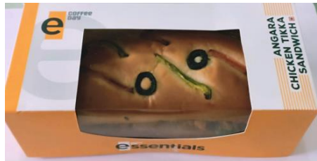
アンガラチキンティッカサンドウィッチ