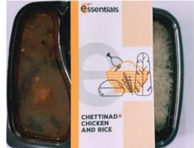
チェティナードチキンライス