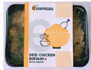
デジチキンピリヤーニ