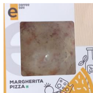
マルゲリータピザ