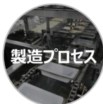
安全を追求した食品製造プロセス