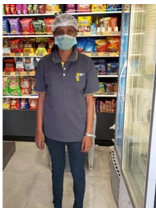
スタッフの服装を写真で報告