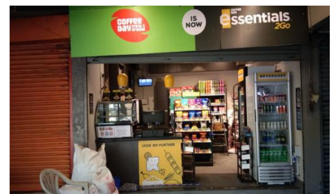
再開している他店舗の数はまだ少なく、両隣が閉店したままの店舗も多い