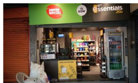
再開している他店舗の数はまだ少なく、両隣が閉店したままの店舗も多い