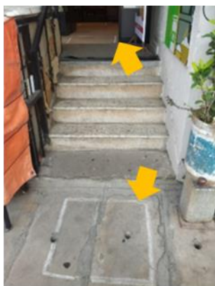
チヨークでお客様の待機位置を明示