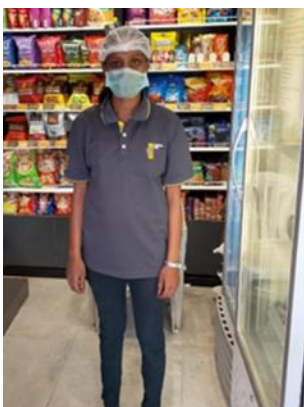
スタッフの服装を写真で報告