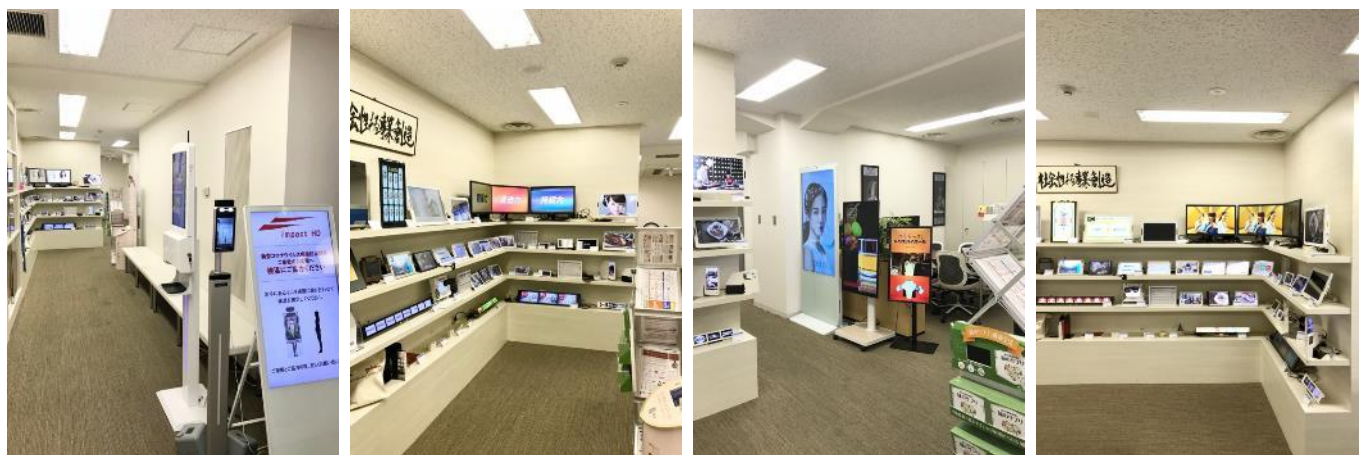
〈オープンスペース イメージ写真〉

当社が展開するデジタルサイネージの製品だけでなく、リアル店舗におけるフィールドマーケティングサービスをワンストップで提供するインパクトホールディングスのグループソリューションもご案内させていただきます。