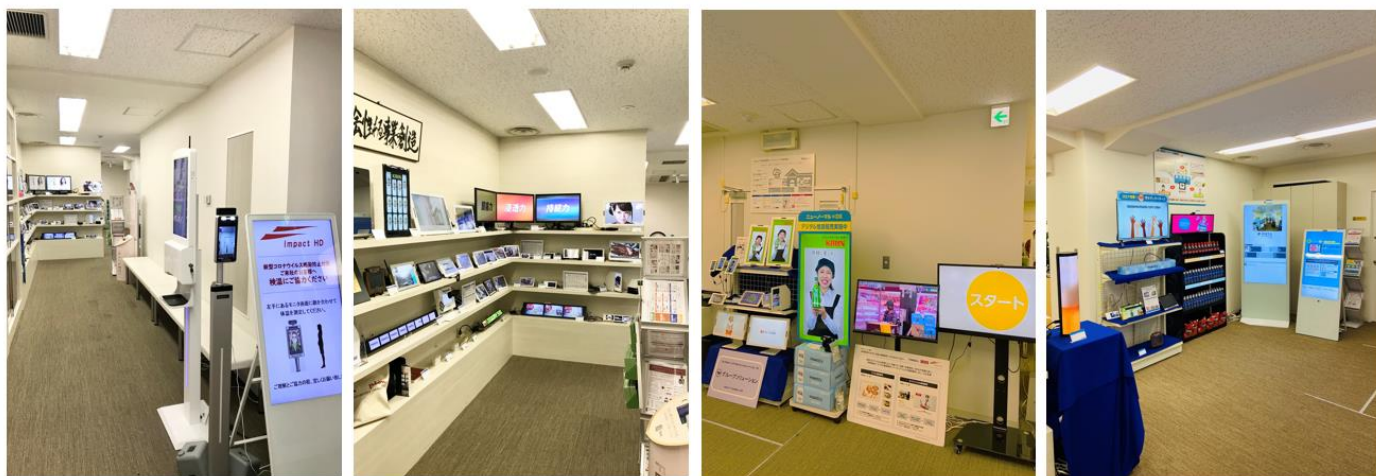
〈オープンスペース イメージ写真〉

当社が展開するデジタルサイネージの製品だけでなく、リアル店舗におけるフィールドマーケティングサービスをワンストップで提供するインパクトホールディングスのグループソリューションもご案内させていただきます。