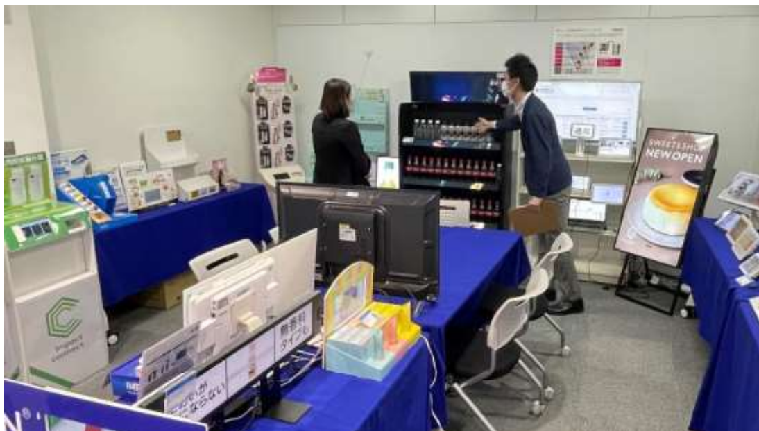
<会場 イメージ写真>

「iTV Private Show 2021」は、店頭販促に存在する多くの「非効率」「ムダ」をなくし、SDGsに対応する販促の全体最適を提言する展示会です。SDGs 販促をテーマに様々な製品・サービスを展開する当社グループ会社が一同じに集う展示会として「プチ体験、プチ感動」をコンセプトとし、販促活動の効率化に向けてAI分析で効果的な店舗抽出ができる店舗DBをはじめ、ペーパーレス化、DXを推進するサイネージ、最新技術や海外生産のノウハウを応用した業務用ICT及びIoT製品を展示。さらにムダ配送の削減に貢献する物流一括管理、ラウンダーによる販促物設置率向上等、当社グループが展開するSDGs販促支援サービスをご案内させていただきました。