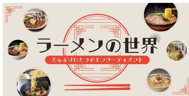
全国各地の有名店の即席ラーメンを集めた「ラーメンの世界」