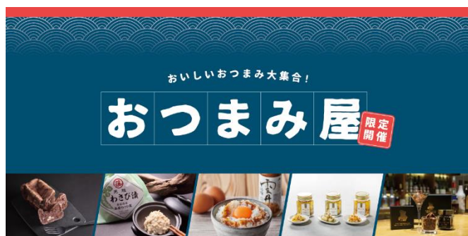
北海道の知る人ぞ知る絶品おつまみを集めた「おつまみ屋」