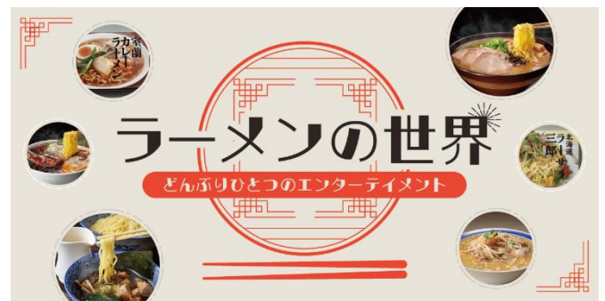
全国各地の有名店の即席ラーメンを集めた「ラーメンの世界」