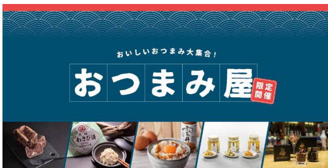
北海道の知の人ぞ知る絶品おつまみを集めた「おつまみ屋」