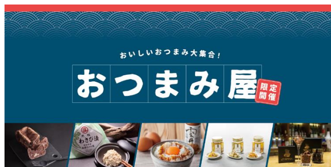
北海道の知人ぞ知る絶品おつまみを集めた 「おつまみ屋」