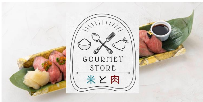
ごはんとお肉のお持ち帰りグルメを集めた 「GOURMET STORE 米と肉」